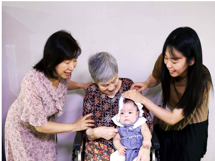
2등 - 가족사랑? 멀리 있지 않아요

코로나19로 외출을 할수 없는 시기에 가족과 함께 있는 모습을 담은 사진입니다. 아이가 주는 기쁨과 가족의 소중함을 깨닫고 이로 인해 모두가 어려운 시기에 삶의 희망을 찾고 생명의 탄생과 가족의 의미를 되새기자는 의미를 담은 사진입니다.