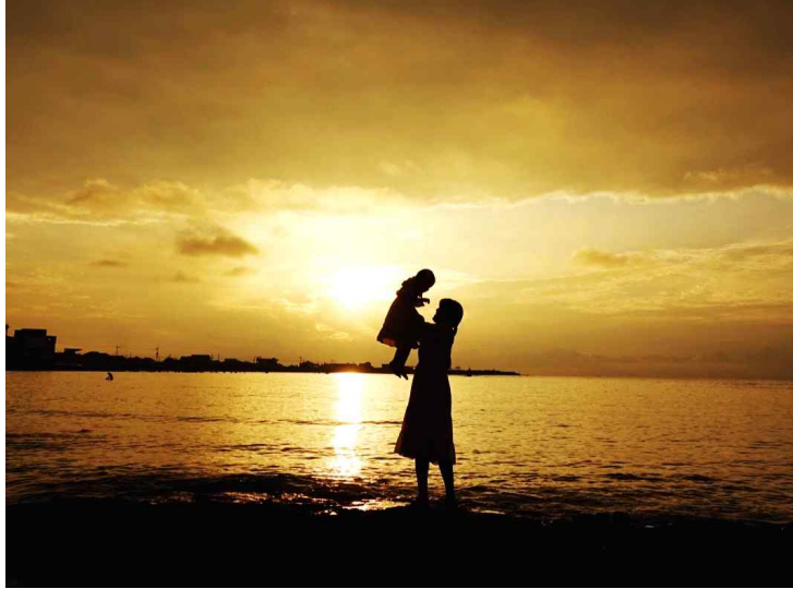
1등 - 그대는 나의 천사인

고되고 힘든 하루를 보내고 집으로 돌아갔을 때 반겨주는 딸이 햇살이자 희망이라는 의미를 담은 사진입니다.